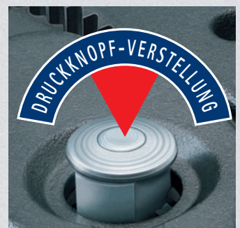
Feinverstellung per Druckknopf: schnell und komfortabel