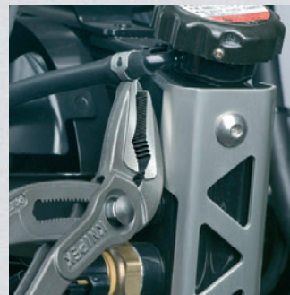
Optimaler Zugang zum Werkstück. Ideal für Service und Instandhaltung, Geräte-reparatur, Fahrzeugbereich und Industrie

Wegen der zunehmenden Kompaktheit von Bauteilen und Geräten wird der Arbeitsraum immer beengter. Die Anforderungen an Greifkräfte und Werkzeugkapazitäten werden aber nicht geringer. Die KNIPEX-"Cobra" ES ermöglicht es, auf beengtem Raum kräftig zuzupacken.