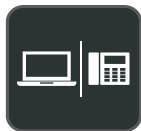
Anschluss mehrerer Geräte