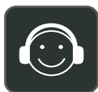
Tragekomfort für den ganzen Tag