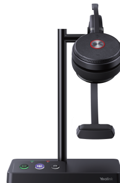
WH62 Mono Teams WH62 Mono UC