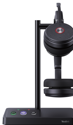
WH62 Dual Teams WH62 Dual UC

Hundertten Kopfform-Bewertungen und tausenden Tragekomforttests zufolge erfüllt der WH62 nahezu alle ergonomischen Anforderungen. Mit erstklassigen weichen Lederpolstern und seinem leichten Design lässt er sich zudem den ganzen Tag bequem tragen. Und für mehr Bewegungsfreiheit beim Arbeiten lässt sich der WH62 auch mit bis zu 160 m Abstand vom Tisch entfernt einsetzen.